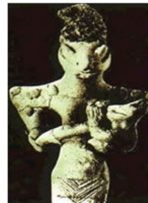
Enlil: dios del aire