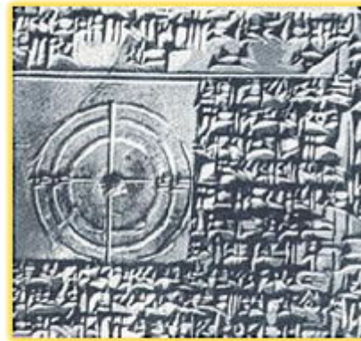
Tabla de multiplicar