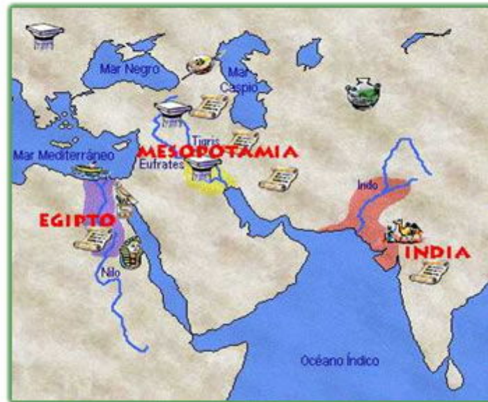
Mapa de Mesopotamia

Geográficamente, esta zona se encuentra dividida en dos: al norte, la alta Mesopotamia, de llanuras altas, montañosas y frías, donde se instalaron los asirios y acadios ; y al sur, la baja Mesopotamia, formada por llanuras fértiles de clima cálido que fueron habitadas por sumerios y babilónicos .