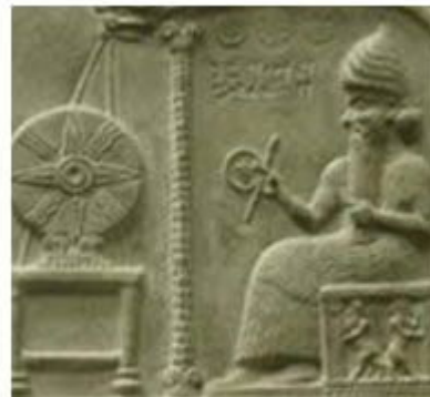
An: dios del cielo

Existía una jerarquía de Dioses: Los principales eran An , el dios del cielo; Ki , la diosa de la tierra; Enlil , el dios del aire; Enki , el dios del agua. Según la creencia Sumeria, cuando los humanos morían, sus espíritus descendían al mundo inferior, donde la vida era peor que la de este mundo.