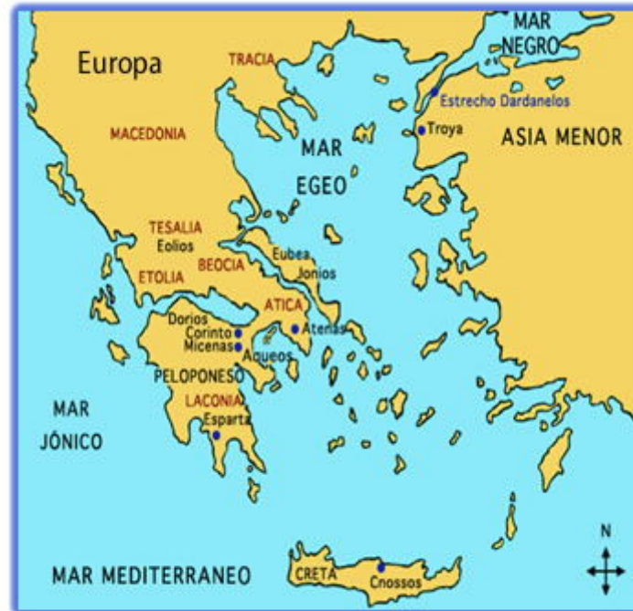
Territorio habitado por los Griegos.

Los griegos desarrollaron una de las más brillantes civilizaciones de la antigüedad alcanzando su apogeo en el siglo V a. C.