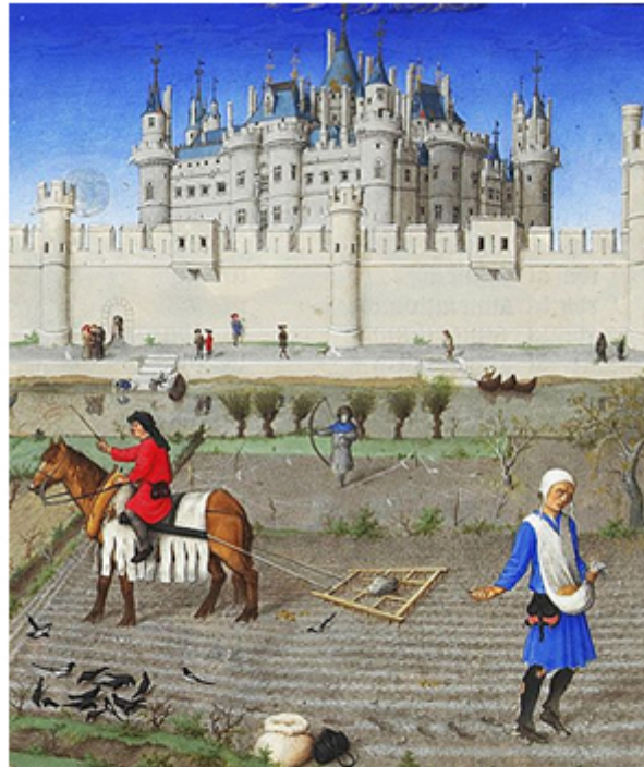
Castillo y labores agrícolas, miniatura de, Las muy bellas horas del duque de Berry.

Los campesinos para tener derecho a los mansos debían jurar fidelidad y ayuda al señor mientras este les daba protección. El campesino debía trabajar las tierras de la reserva señorial unos días por semana y pagar impuestos por la explotación de los mansos y el uso de los recursos del feudo (molinos, madera, etc.).