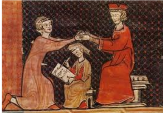
Ceremonia de homenaje

Para convertirse en vasallo había que cumplir una ceremonia, el homenaje de la investiduras , donde se juraba fidelidad al señor (rey o noble de mayor rango) y este le daba protección.